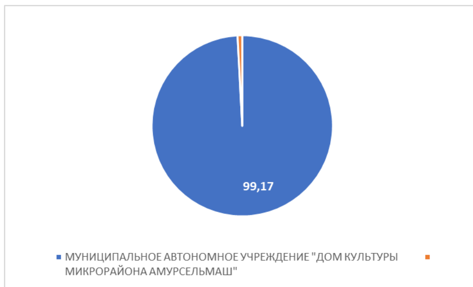
Рисунок 2 – Интегральный показатель по критерию «Комфортность условий предоставления услуг»

По второму критерию «Комфортность условий предоставления услуг» МУНИЦИПАЛЬНОЕ АВТОНОМНОЕ УЧРЕЖДЕНИЕ "ДОМ КУЛЬТУРЫ МИКРОРАЙОНА АМУРСЕЛЬМАШ" набрало 99,17 балла (Рис.2).