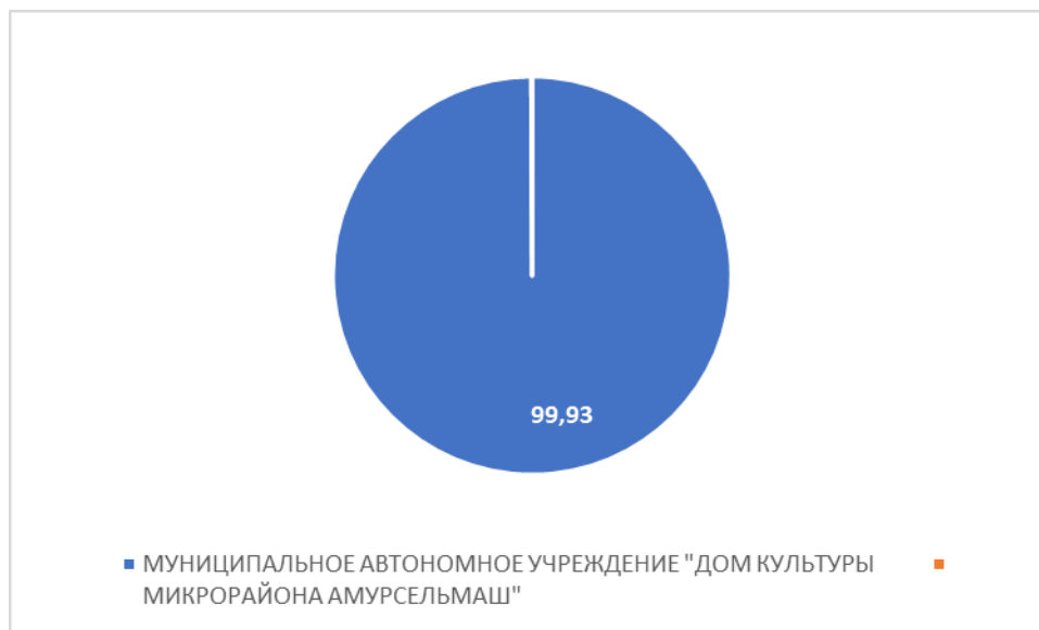
Рисунок 4 – Интегральный показатель по критерию «Доброжелательность, вежливость работников организации»

По четвертому критерию «Доброжелательность, вежливость работников организации» МУНИЦИПАЛЬНОЕ АВТОНОМНОЕ УЧРЕЖДЕНИЕ "ДОМ КУЛЬТУРЫ МИКРОРАЙОНА АМУРСЕЛЬМАШ" набрало 99,93 балла (Рис. 4).