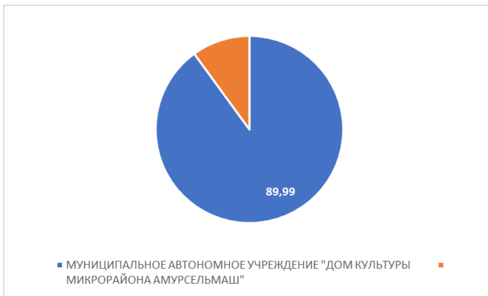
Рисунок 1 – Интегральный показатель по критерию «Открытость и доступность информации об организации культуры»

По первому критерию «Открытость и доступность информации об организации культуры» МУНИЦИПАЛЬНОЕ АВТОНОМНОЕ УЧРЕЖДЕНИЕ "ДОМ КУЛЬТУРЫ МИКРОРАЙОНА АМУРСЕЛЬМАШ" набрало 89,99 балла (Рис.1).